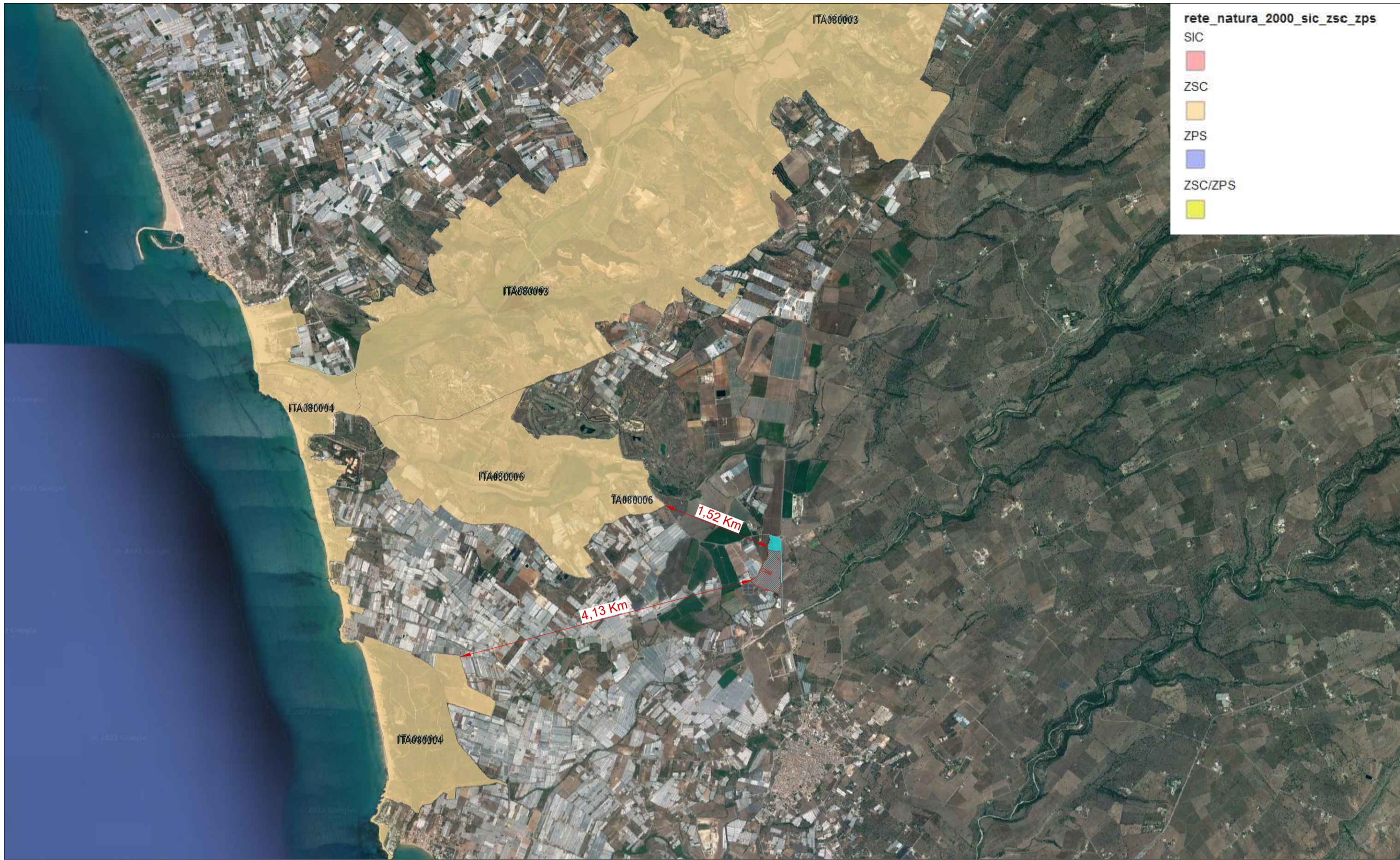
AREE SIC E ZPS SCALA 1:50.000